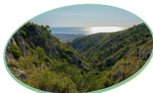
OROPESA DEL MAR