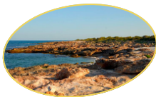
ALCALÀ DE XIVERT