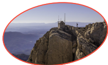
VISTABELLA DEL MAESTRAT