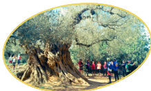
CANET LO ROIG