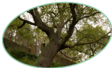
LA SERRA D'EN GALCERAN