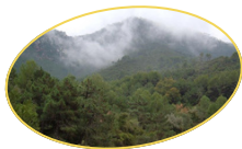
LA POBLA DE BENIFASSÀ