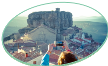
ARES DEL MAESTRAT