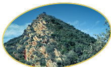
NULES Y LA VILAVELLA