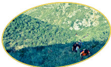
SANTA MAGDALENA DE POLPÍS